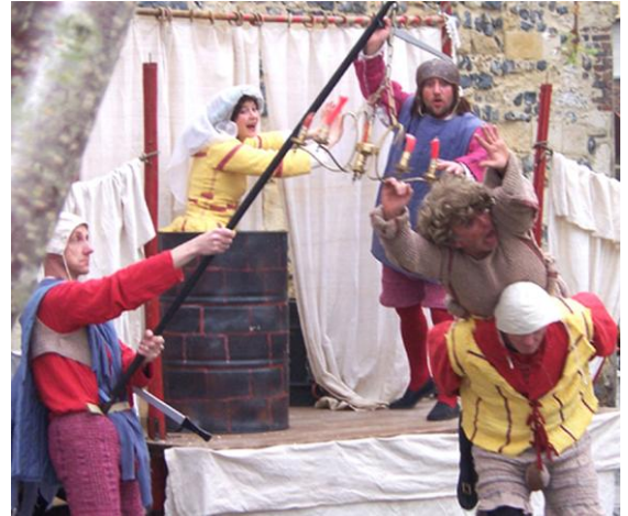
La Compagnie Machtiern