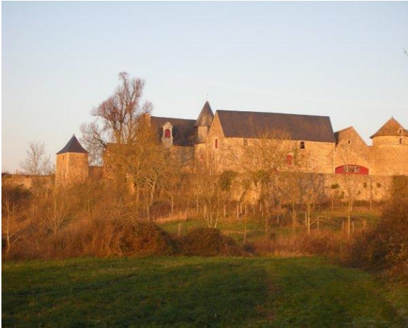
Le Logis, à Fontenay-sur-Vègre